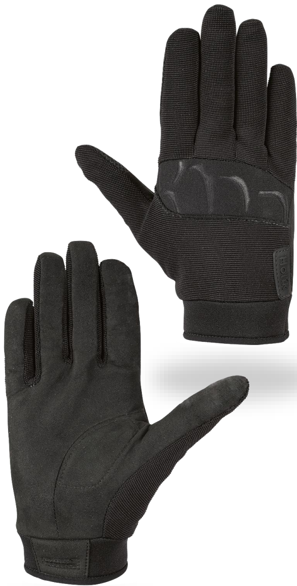
EBBE Short Black

Lehké textilní rukavice vhodné pro snadnou manipulaci se zbraní i k použití při prohledávání osob. Určené pro všechny armádní, policejní a security jednotky.